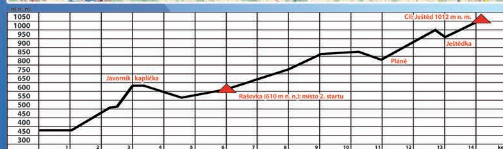
Start: Hodkovice nad Mohelkou – náměstí Cíl: Ještěd 14,2 km, 1012 m n. m.